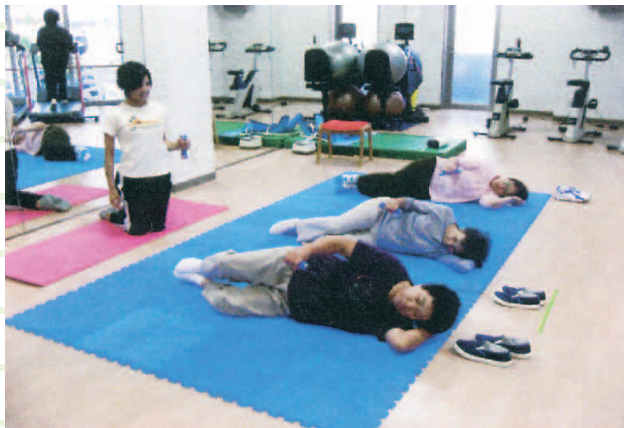
ダンベルでのトレーニングの様子です。

トレーニングとして、肩のインナーマッスルの強化をしました。インナーマッスルとは、簡単に言うと肩関節を固定し安定させる筋肉であり、目で見える筋肉（アウターマッスル）の下にある筋肉のことです。このインナーマッスルを軽いダンベルで鍛えると肩の痛み予防に効果的だと言われています。